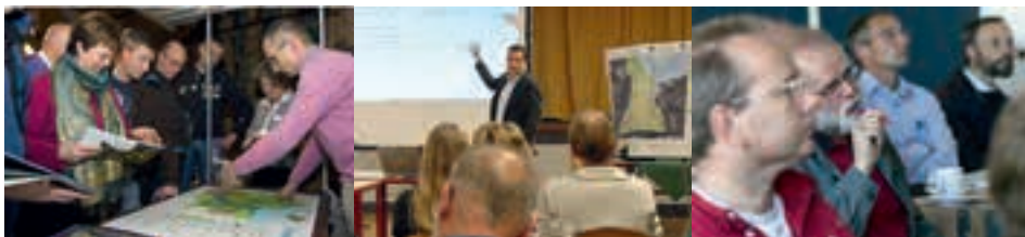
Bewoners en ondernemers uit Zeeland praten over uitbreiding van hun dorp onder leiding van TNO.

Marc Rijnveld en Mike Duijn, TNO www.tno.nl