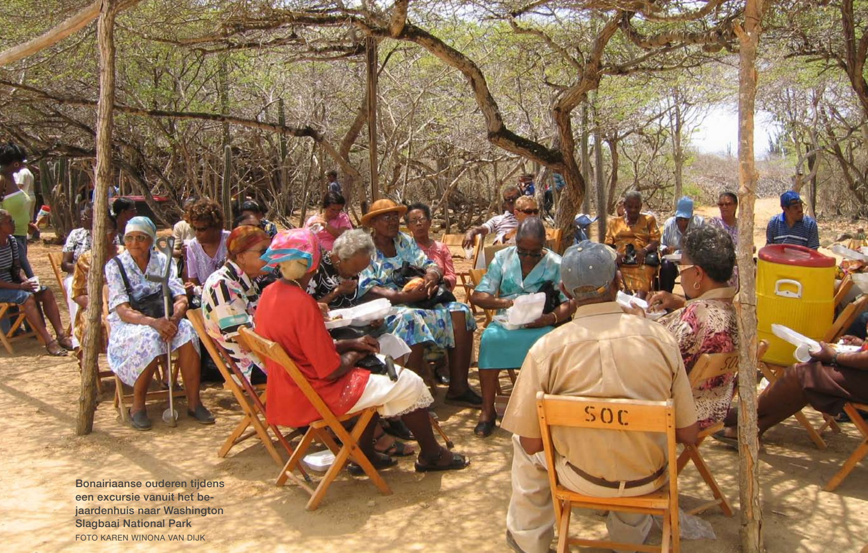
Bonairiaanse ouderen tijdens een excursie vanuit het bejaardenhuis naar Washington Slagbaai National Park

ondersteuning en middelen vanuit Nederland voor onderzoek en monitoring. Zo zijn zij beter in staat kennis van de natuur op te bouwen en die dus nog beter te beschermen. Want de natuur is voor de eilanden van onschatbare waarde. Zo is tachtig procent van de inkomsten van Bonaire afkomstig uit duiktoerisme. Natuurbehoud dient dus een groot economisch belang. Gezaghebber van Bonaire Glenn Thodé zegt daarover: “Er zal geen situatie ontstaan van economie versus ecologie, ze zullen altijd hand in hand gaan. Wij als bestuurders zorgen dat Bonaire zijn ecolo-