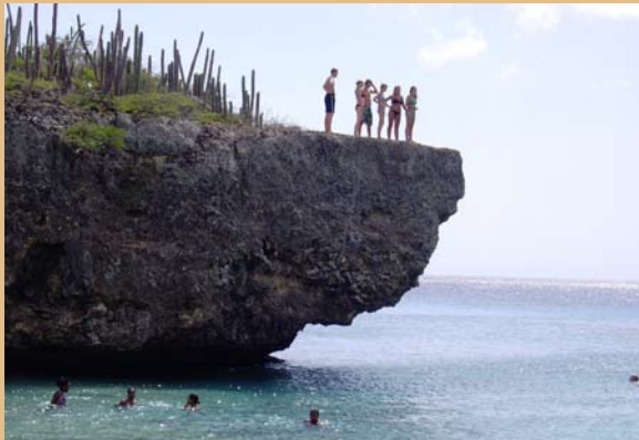
Springen van hoge kliffen op Bonaire is een populair tijdverdrijf onder jongeren.

gemeenten worden zoals wij die in Nederland kennen. Daarvoor hebben ze simpelweg te weinig bestuurskracht en capaciteit. Natuurlijk is de context ook heel anders en de afstand tot andere Nederlandse bestuurslagen is groot. En vanuit Saba rij je niet even naar Den Haag als je iets met een rijksambtenaar wil overleggen.”